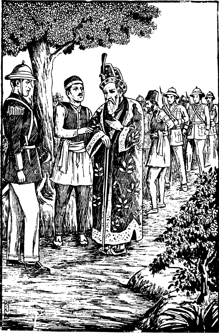
बहादुरशाह की गिरफ्तारी